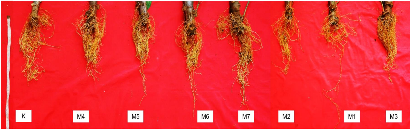
Gambar 1 Pengaruh inokulasi fungi mikoriza arbuskula pada akar tanaman singkong pada 8 MST. M1 G. manihotis , M2 A. tuberculata-G. rubiforme , M3 Gigaspora sp., M4 A. tuberculata-G. manihotis-G. rubiforme , M5 G. manihotis-Gigaspora sp, M6 A. tuberculata-G. rubiforme-Gigaspora sp., M7 A. tuberculata- G. manihotis-G. rubiforme-Gigaspora sp. Pupuk dasar NPK diaplikasikan sesuai dengan dosis rekomendasi untuk perlakuan kontrol dan diberikan 75% dosis rekomendasi untuk perlakuan aplikasi FMA.