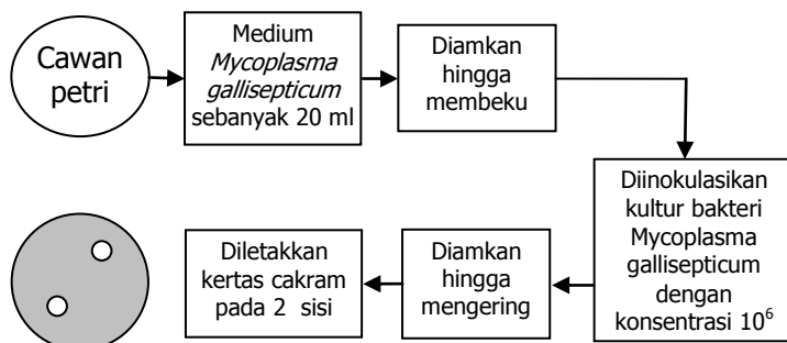
Gambar 1. Alur pengujian anti - Mycoplasma gallisepticum ekstrak jahe

Untuk mengetahui golongan senyawa yang bekerja sebagai antibakteri. Ekstrak yang diperoleh kemudian difraksinasi dengan kloroform, hexan, etilasetat, dan metanol. Aktivitas antibakteri fraksi fraksi yang diperoleh selain diuji terhadap M. gallisepticum , aktivitas nya juga diuji terhadap E. coli . Setelah itu, komponen senyawa yang terkandung dalam ekstrak dan fraksi diperiksa dengan Kromatografi Lapis Tipis (KLT) menggunakan fase diam silica gel GF 254 , dan fase gerak n heksan : dietil eter (8 : 2). Uji antibakteri terhadap E. coli dilakukan dengan metoda cakram Kirby – Bauer pada media nutrient agar yang mengandung natrium kloride, glukosa, casein, papaic digest of soy bean , kalium dihidrogen fosfat dan agar.