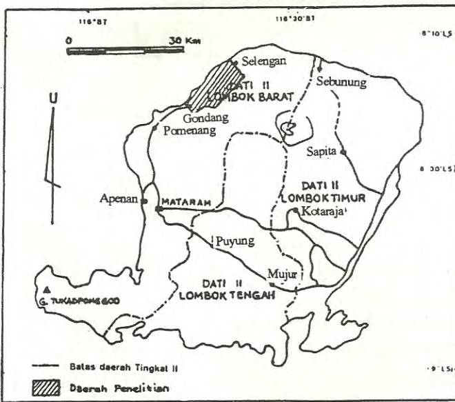
Peta 1. Lokasi daerah penelitian Gondang-Selengan, NTB

Berdasarkan group fisiografi sistem LREP (1988) daerah penelitian termasuk dalam 5 group fisiografi yaitu Aluvial, Volkan, Perbukitan, Pegunungan dan Micellaneous. Bentuk wilayah datar sampai bergunung dengan persentase lereng sangat bervariasi dari 0 - 75 % dan terletak pada ketinggian 0 sampai 500 m di atas permukaan laut.