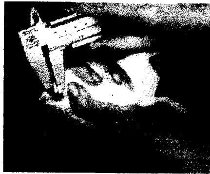
Gambar 2. Cara mengukur panjang gigi