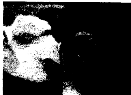
Gambar 4. Gigi tikus sudah sama panjang