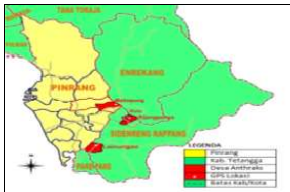
Gambar 5. Peta lokasi kasus anthraks di Pinrang dan Sidrap dan batas wilayah kabupaten tetangga

menjadi perhatian bagi wilayah kabupaten tetangga seperti halnya kabupaten Enrekang, Tana Toraja, Kota Pare Pare, kabupaten Polewali Mandar dan Mamasa. Pengawasan lali lintas ternak ruminansia dan produknya dari daerah kasus wajib diperketat terutama pada kabupaten tetangga, agar wilayah mereka tidak turut tertular anthraks. Deskripsi GPS pemetaan kasus anthraks di Pinrang dan Sidrap dapat dilihat pada Gambar 5.