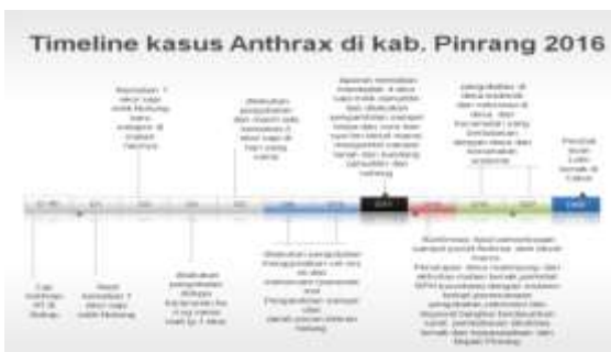
Gambar 2. Kerangka waktu kasus anthraks di Kabupaten Pinrang tahun 2016