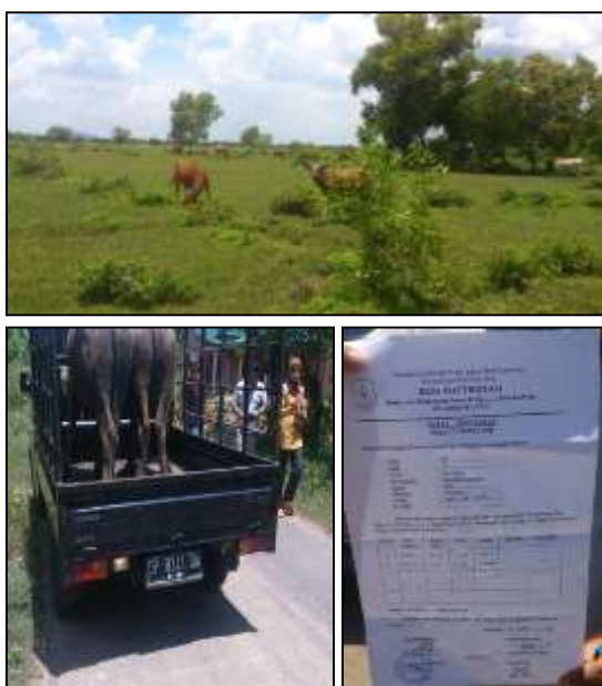
Gambar 6. Faktor-faktor resiko penyebaran kasus Anthraks di Kabupaten Pinrang

Faktor risiko penyebaran kasus anthraks di Pinrang antara lain yaitu pola pemeliharaan ternak yang digembalakan, lemahnya pembatasan dan pengawasan lalu lintas sejak awal kejadian kasus hingga kasus tersebut di simpulkan / di diagnosa masih kurang, dibuktikan dengan ditemukannya lalu lintas ternak (kerbau) melalui daerah kasus tanpa Surat Keterangan Kesehatan Hewan (gambar 6) dan lemahnya deteksi,identifikasi kasus terjadi pada manusia yang terpapar oleh anthraks.