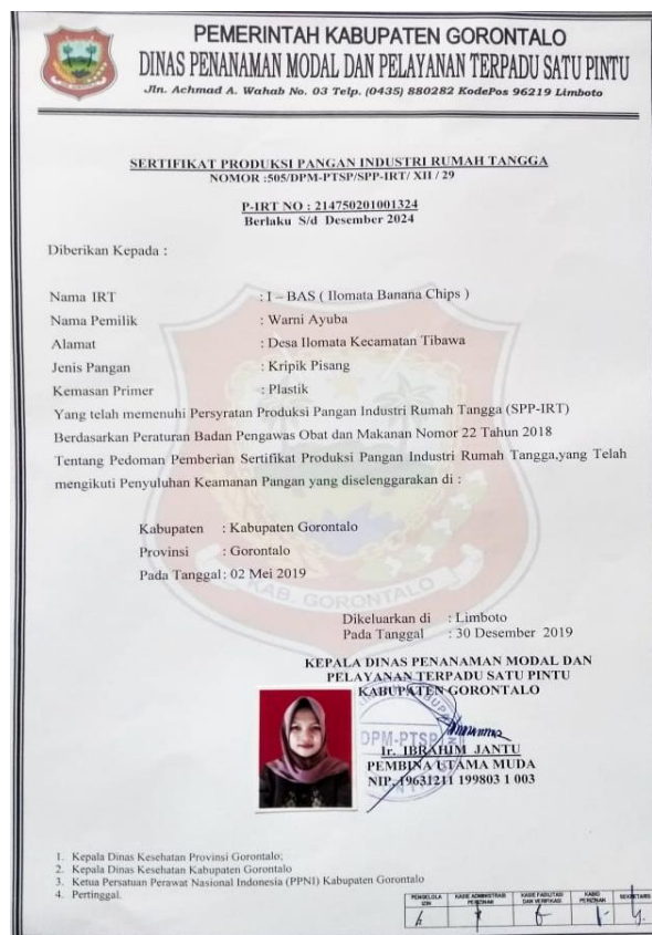
Gambar 6 Sertifikat PIRT kelompok I-Bas.

Kegiatan pengabdian masyarakat dalam bentuk pemberdayaan kelompok PKK Desa Ilomata, Kecamatan Tibawa, Kabupaten Gorontalo melalui wirausaha keripik pisang aneka rasa difokuskan pada kegiatan pelatihan pembuatan keripik pisang aneka rasa, pelatihan pembukuan sederhana, dan pelatihan pemasaran produk. Produk keripik pisang yang dihasilkan diberi nama keripik pisang I-Bas ( Ilomata-Banana chips ) dengan nomor izin edar PIRT 214750201001324 dan telah dipasarkan baik secara offline maupun online . Untuk keberlanjutan program ini disarankan kepada anggota kelompok PKK agar senantiasa berlatih secara mandiri terkait keterampilan-keterampilan yang telah diajarkan serta diperlukan pula kerja sama dengan pemerintah desa agar dapat memberikan motivasi dan pendampingan kepada anggota kelompok PKK secara kontinu.