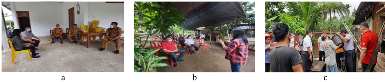
Gambar 1 a) Pertemuan dan koordinasi dengan Dinas Pertanian Kabupaten Minahasa Selatan; b) Penyuluhan tentang penerapan teknologi biogas; dan c) Pengisian bahan limbah ke digester biogas.

dihasilkan dan banyaknya biogas yang diinginkan. Instalasi biogas yang digunakan disajikan pada Gambar 2.