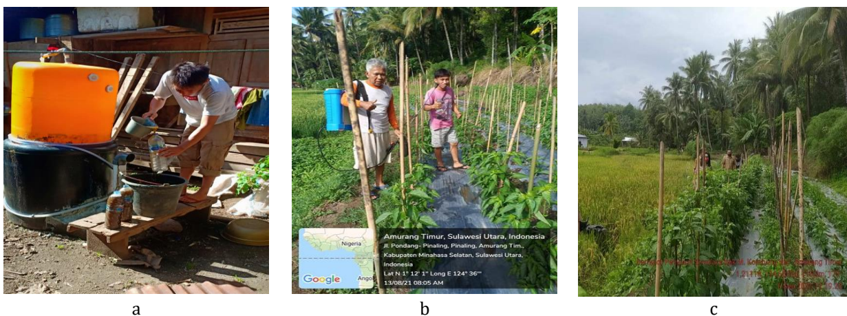
Gambar 4 a) Panen pupuk organik cair; b) Aplikasi pupuk organik cair pada demplot tanaman cabe; dan c) Aplikasi pupuk organik cair pada padi sawah

Penerapan teknologi biogas pada kelompok tani di Desa Pinaling dapat menghasilkan POC 10 L/minggu dan dapat diaplikasikan pada demplot tanaman padi dan cabe. Gambar 4 menunjukkan panen POC dan aplikasinya pada demplot tanaman cabe dan padi sawah. Petani menggunakan dosis 50% pupuk NPK Phonska dan pemberian POC dua kali seminggu mulai tanaman berumur 3 minggu setelah pindah tanam (MST) sampai umur 8 MST untuk tanaman padi sawah. Dosis pemberian POC adalah 1 bagian POC: 10 bagian air. Berdasarkan hasil pengamatan pada saat panen padi diperoleh kenaikan hasil sebesar 62,5%. Hasil panen padi sawah pada musim tanam sebelumnya sebesar 400 kg/150m 2 (0,5 tektek), setelah dilakukan pemberian POC hasil biogas, diperoleh hasil panen sebesar 650 kg/150m 2 (0,5 tektek). Dapat disimpulkan bahwa penerapan teknologi biogas dapat menghemat pupuk kimia sebesar 50% dan dapat meningkatkan hasil padi sawah sebesar 62,5%.