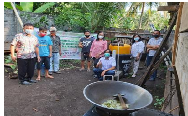
Gambar 3 Panen biogas dan pemanfaatannya sebagai sumber bahan bakar pengganti LPG.

Pengertian pupuk organik menurut Permentan No. 64 Tahun 2013 adalah bahan yang sebagian besar atau seluruhnya terdiri atas