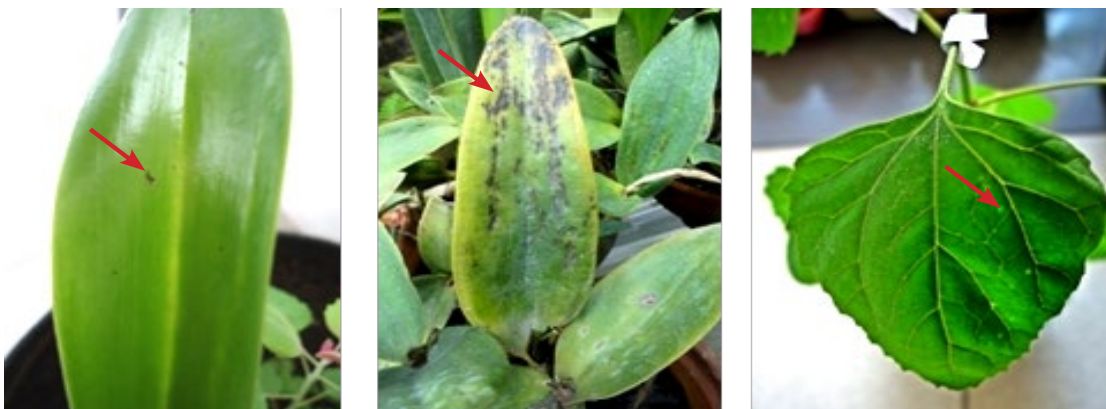
Gambar 1 Gejala Tobacco mosaic virus pada anggrek dan Chenopodium amaranticolor . a, Gejala nekrosis pada daun anggrek muda; b, Flek nekrosis pada daun anggrek dewasa; c, Bercak lokal klorosis pada daun C. amaranticolor . Gejala ditunjukkan dengan tanda panah merah.

Ekstraksi RNA total dilakukan dari 0.1 g sampel daun sakit menggunakan kit komersial Geneaid. RNA total selanjutnya digunakan sebagai cetakan untuk sintesis cDNA. Sintesis cDNA menggunakan total volume 12.5 \mu L dengan protokol sesuai pabrikan (AMV Promega). Tahapan sintesis cDNA dilakukan dengan komposisi pereaksi terdiri atas 1 \mu L RNA, 0.5 \mu L 10 mM primer d(T) dan 3.5 \mu L air bebas nuklease, dicampur hingga homogen, kemudian diinkubasikan pada suhu 70 ^{\circ} C selama 5 menit. Larutan tersebut didinginkan selama 5 menit, selanjutnya digoyang supaya