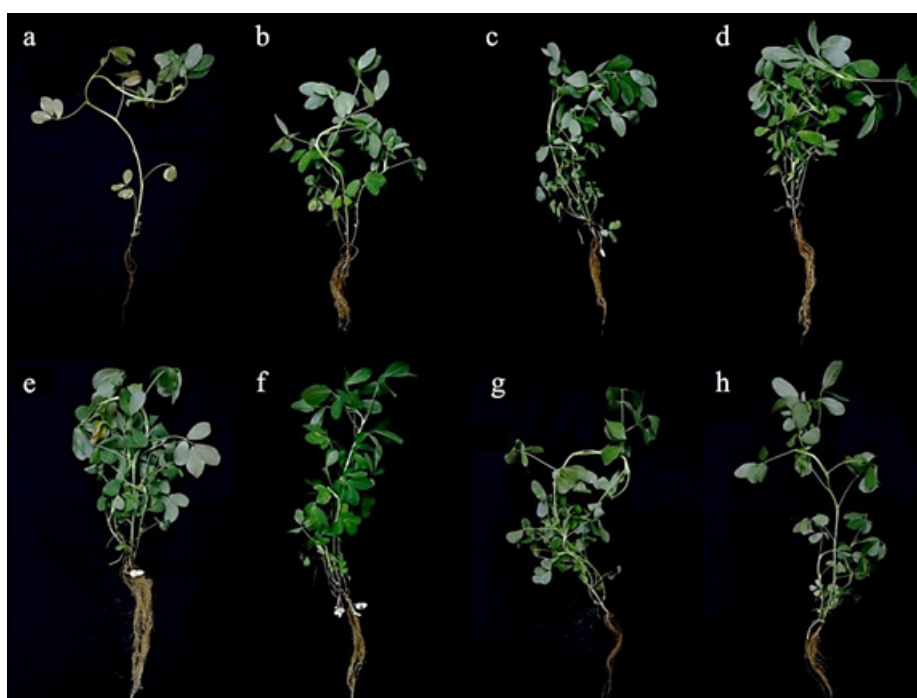
Gambar 2 Pertumbuhan tanaman kacang tanah setelah aplikasi bakteri endofit dan Sclerotium rolfii pada percobaan di rumah kaca. a, Kontrol; b, Isolat BBT25; c, Isolat BBT90; d, Isolat BBT102; e, Isolat BBT106; f, Isolat BBT110; g, Isolat BBT130; dan h, Isolat BSK18.

a Angka pada kolom yang sama dan diikuti huruf yang sama tidak berbeda nyata (uji selang ganda Duncan \alpha 5%).