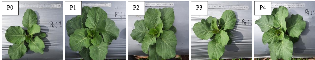
Gambar 1. Keragaan tajuk tanaman kubis umur 3 MST pada berbagai konsentrasi PGPR, P0 (0 ml L -1 ) kontrol, P1 (2.5 ml L -1 ), P2 (5.0 ml L -1 ), P3 (7.5 ml L -1 ), dan P4 (10.0 ml L -1 )