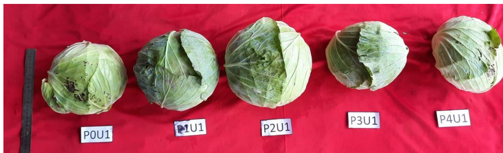
Gambar 2. Keragaan crop kubis utuh pada saat panen (11 MST) pada berbagai konsentrasi PGPR B. subtilis QST713:10 9 CFU ml -1