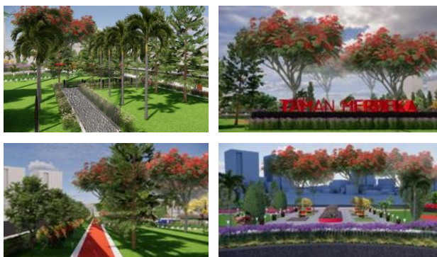
Gambar 5. Ilustrasi Pepohonan