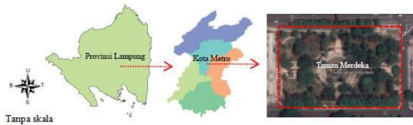
Gambar 1. Peta lokasi Taman Merdeka

Penelitian ini dilaksanakan pada bulan Oktober 2020 hingga Maret 2021. Lokasi penelitian berada di Taman Merdeka Kota Metro, Provinsi Lampung, dengan letak koordinat 5°06'53.06" LS dan 105°18'29.97" BT. Luas tapak penelitian ini sekitar 1,59 ha (Gambar 1).