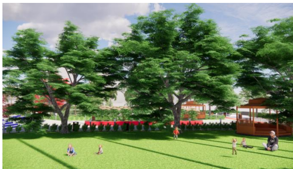
Gambar 6. Ilustrasi Lawn

Adanya penambahan fasilitas lawn bertujuan untuk menambah ruang gerak sosial pengunjung taman dan memperoleh sinar matahari pagi/berjemur (Gambar 6).