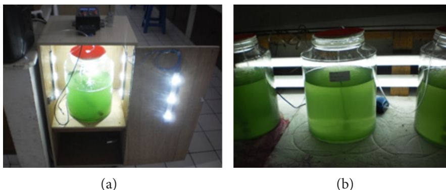
Figure 1 (a) A controlled photobioreactor (FK) and (b) Uncontrolled photobioreactor (FTK)

Pertumbuhan S. platensis dapat ditentukan dari perubahan warna pada media kultivasi yang menandakan peningkatan jumlah populasi atau kepadatan sel yang ditunjukkan dengan pertambahan nilai Optical Density (OD). Nilai OD dapat dilihat pada Figure 2 . Nilai OD semakin meningkat dengan bertambahnya waktu kultivasi. Nilai OD tertinggi diperoleh pada waktu kultivasi antara 9-11 hari. Waktu panen dipilih berdasarkan