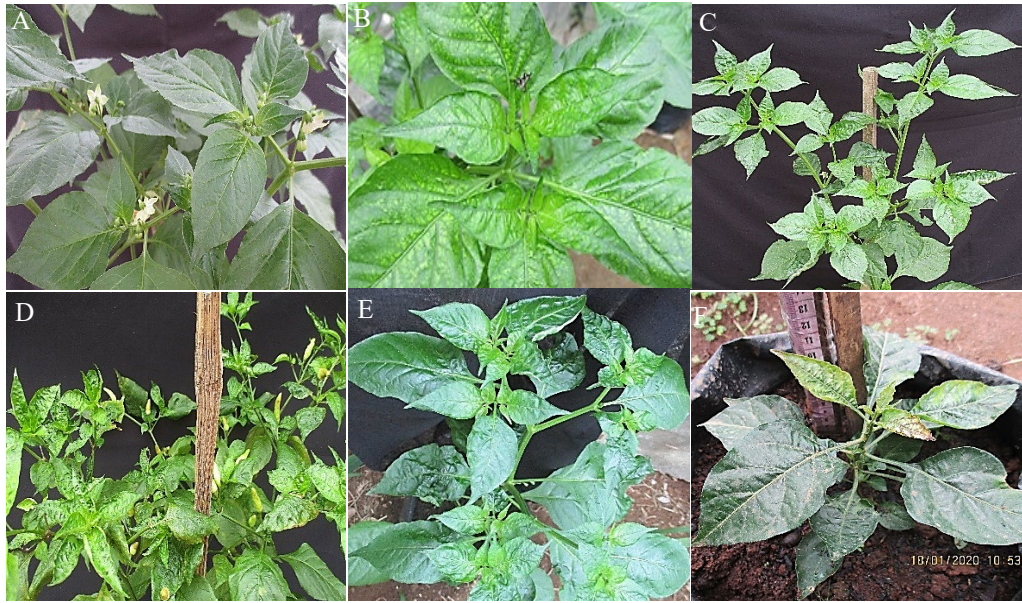
Gambar 1. Perbedaan gejala yang ditimbulkan akibat infeksi penyakit daun keriting kuning (A) tanaman tanpa gejala (skor 0); (B) tanaman berwarna kuning (skor 1); (C) tanaman dengan gejala daun keriting (skor 2); (D) tanaman dengan gejala melengkung ke atas atau ke bawah (skor 3); (E) tanaman dengan gejala daun melengkung ke atas dan ke bawah (skor 4); (F) tanaman kerdil (skor 5)

daun keriting, timbulnya bercak hijau-kuning pada daun, interveinal yellowing , vein swelling , munculnya warna keunguan, terjadi gangguan pertumbuhan tanaman hingga tanaman menjadi kerdil (Czosnek dan Ghanim, 2011; Inoue-Nagata et al. , 2016; Chiemsombat et al. , 2018)).