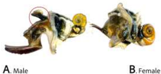
Gambar 3. Organ reproduksi siput gonggong jantan berupa tonjolan (A), sementara pada jenis kelamin betina tidak memiliki tonjolan (B). Keterangan: tanda O menunjukkan organ reproduksi jenis kelamin jantan.

Berdasarkan Tabel 1, panjang cangkang siput gonggong jenis S. canarium yang dikumpulkan nelayan mulai dari ukuran kecil sebesar 2,52 cm atau 25,2 mm untuk siput gonggong jenis kelamin jantan, dan sebesar 5,07 cm untuk jenis kelamin betina. Dengan demikian, sampel dianalisis secara morfologi dengan cara identifikasi tanda khusus berupa tonjolan dan dikonfirmasi secara anatomi. Hasil identifikasi secara anatomi (Gambar 3) menunjukkan terdapat perbedaan ber-dasarkan jumlah koleksi sampel menurut perbandingan jenis kelamin jantan dan betina pada masing-masing spesies.