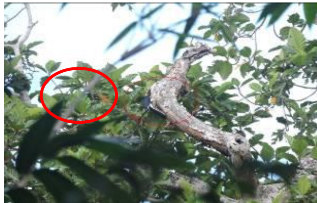
Gambar 3 Kangkareng perut-putih mengunjungi lubang sarang dipohon bendo

Berdasarkan hasil penelitian didapatkan bahwa perilaku bersarang terdapat di hutan alam dataran rendah JPB pada lubang pohon bendo (Gambar 3). Hal ini disebut sebagai perilaku bersarang karena pada saat pengamatan terlihat kangkareng perut-putih jantan sedang mengunjungi lubang sarang yang digunakan kangkareng perut-putih untuk bertelur dan mengeraminya. Frekuensi total perjumpaan kangkareng perut-putih mengunjungi lubang sarang sebanyak 3 kali dan selama 15 menit.