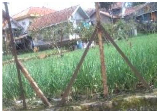
Gambar 5 Pemanfaatan pekarangan

Letak desa yang berdekatan dengan kawasan konservasi membuat larangan maupun pemahaman untuk melestarikan lingkungan tertanam di keseharian masyarakat. Masyarakat percaya bahwa bumi diciptakan untuk dimanfaatkan sebaik-baiknya oleh manusia dan tidak boleh ada yang sia-sia. Oleh karena itu masyarakat terlihat memanfaatkan setiap lahan di rumahnya untuk pertanian produktif (Gambar 5).