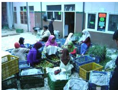
Gambar 4 Pondok Pesantren Al-Ittifaq

Pondok pesantren Al-Ittifaq (Gambar 4) berdiri di desa ini dan bergerak di bidang agronomi. Tokoh agama dari pondok pesantren ini dipandang dan dihormati masyarakat dan santrinya terlibat dengan keseharian masyarakat. Berdasarkan pengakuan, kepala desa menjabat saat ini juga merupakan santri dari pondok pesantren tersebut. Pondok pesantren ini berperan dalam pertumbuhan masyarakat.