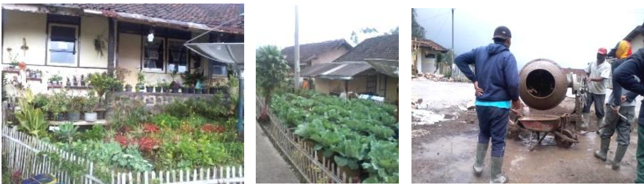
Gambar 1 Suasana RW 13 Patengan Baru

menimbulkan kepercayaan. Sebagai masyarakat berbasis pertanian, interaksi antara satu masyarakat dengan yang lainnya juga terjadi di lahan pertanian. Masyarakat biasanya akan saling tolong menolong untuk meningkatkan hasil pertanian. Masyarakat perkebunan memiliki ikatan lebih kuat, terlihat di RW 13 Patengan Baru (Gambar 1). RW ini merupakan kumpulan rumah dinas untuk pegawai perkebunan. Orang yang memiliki posisi di perkebunan dihormati dan ditaati lebih daripada tokoh lainnya dan ini memudahkan pelaksanaan suatu program. Patengan baru menjadi desa yang akan dikembangkan sebagai desa wisata dengan upaya dari warganya sendiri dan sudah mendapatkan dukungan dari pemerintah desa. Pembangunan sarana umum di Patengan baru dilaksanakan dengan sistem gotong royong dengan dana bersama dan bantuan dari desa.