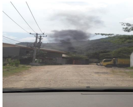
Gambar 6 Pembakaran kapur di sekitar lokasi wisata