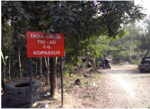
Gambar 10 Lokasi kawasan melalui tanah milik Kopassus