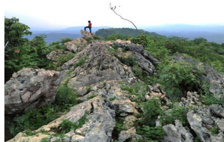
Gambar 2 Puncak Lalana