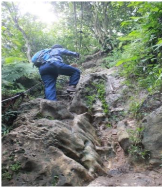
Gambar 4 Pengaman tali pada jalur pendakian

Aspek kebersihan lokasi menjadi pertimbangan dalam menentukan lokasi wisata dengan total skor 150. Pengembangan ekowisata di Gunung Kapur saat ini masih memiliki kendala dalam pengelolaan kebersihan karena pada jalur menuju kawasan ekowisata terdapat tempat pembakaran kapur yang dinilai kurang menarik dan dari segi kebersihan sehingga dapat mengganggu kenyamanan wisatawan (Gambar 6).