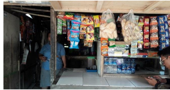
Gambar 9 Warung warga di lokasi penelitian