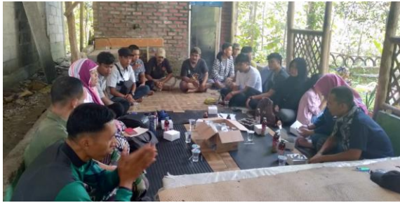
Gambar 8 Gedung pertemuan