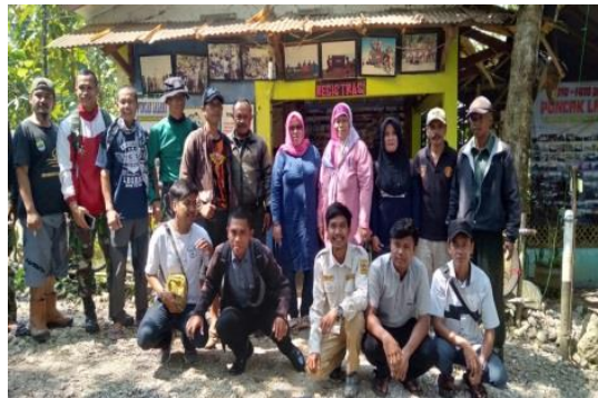
Gambar 12 Suasana setelah diadakannya FGD dengan foto bersama