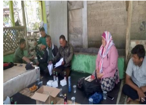
Gambar 11 Suasana saat diadakan FGD