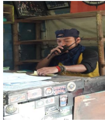
Gambar 5 Salah satu pengelola wisata yang berkoordinasi dengan petugas lapangan