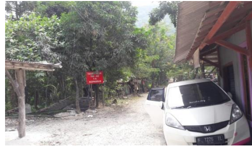
Gambar 7 Akses menuju lokasi wisata