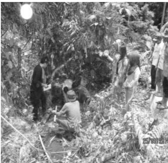
Gambar 3 Partisipasi masyarakat saat mencari sumber mata air

Kegiatan yang melibatkan partisipasi masyarakat pada tahap pelaksanaan adalah mencari sumber mata air ke dalam hutan dengan jarak tempuh \pm 2 Km untuk mendapat sumber mata air yang layak. Kemudian air tersebut akan diambil untuk di cek di laboratorium, dapat dilihat pada Gambar 3 di bawah ini.