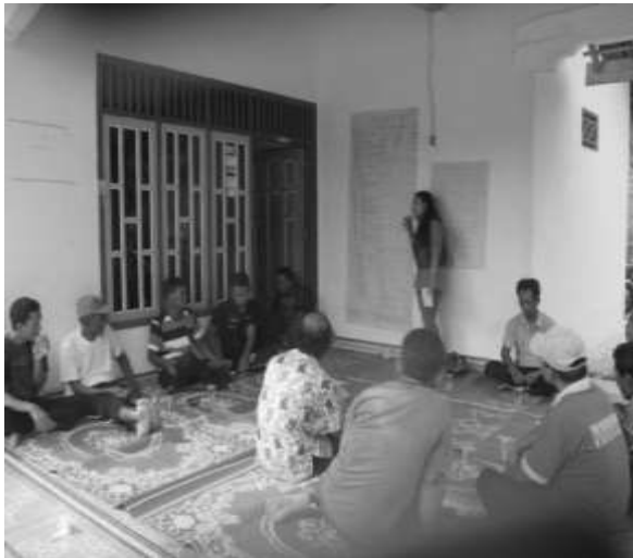
Gambar 4 Pleno RKM

Sumber Data: Pamsimas III Kabupaten Bungo (2017)