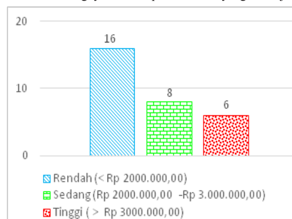
Gambar 4 Diagram Besaran Pendapatan Nelayan yang Bersumber dari Non Perikanan