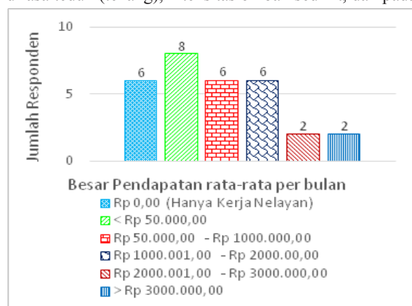
Gambar 3 Diagram Tingkat Pendapatan Nelayan Desa Pulau Panjang Bersumber dari Sektor Perikanan Tangkap

Komunitas nelayan di Kabupaten Natuna, pada umumnya menggunakan prediksi musim angin untuk melakukan aktivitas penangkapan di laut. Selain musim hujan dan kemarau, komunitas nelayan di Natuna khususnya desa Pulau Panjang mengenal pola musim angin timur, angin selatan, angin barat, dan angin utara. Pola musim yang dianut nelayan ini menjadi hal penting yang sangat diperhatikan nelayan dalam bekerja di laut. Musim angin timur adalah musim dengan kondisi gelombang laut yang dirasa teduh (tenang), intensitas ombak sedikit, dan pada